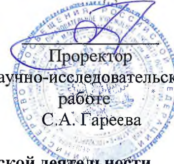
График проведения промежуточной аттестации аспирантов по научно-исследовательской деятельности во втором семестре 2023-2024 уч. года